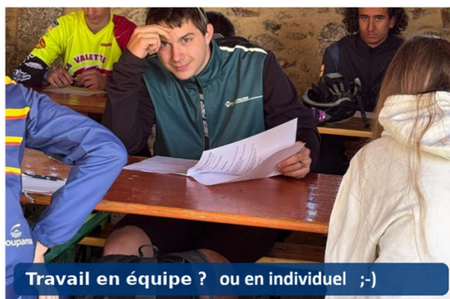
Travail en équipe ? ou en individuel ;-)

Les participants au Critérium National ont, quant à eux, abordé les épreuves théoriques liées à la vie fédérale, à la santé, à la nature et à l'environnement, ainsi qu'à la cartographie.