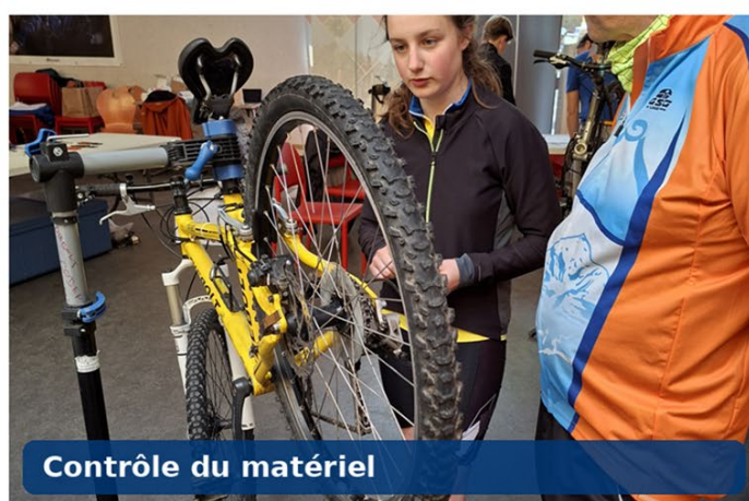
Contrôle du matériel